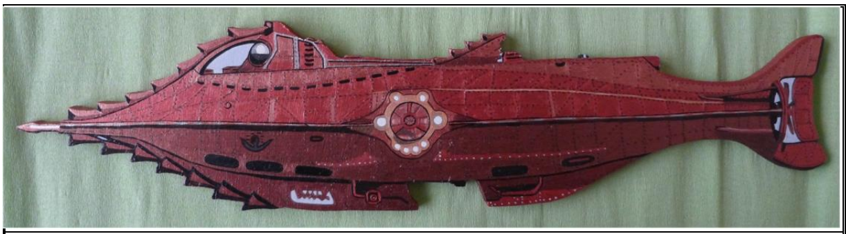
Le sous-marin imaginé par Jules Verne

Comme pour les précédentes créations, nous aurons le souci d'inscrire ce travail visuel et sonore dans une dramaturgie simple permettant d'amplifier le caractère poétique....en référence notamment au monde de Jules Verne et plus largement à l'imaginaire lié au monde sous-marin(littérature/Bandes dessinées/cinéma).