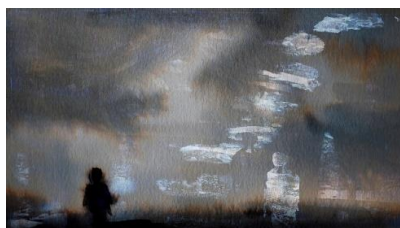
Histoire de fantômes –

Il collabore sur 2018 et 2019 à l'écriture/mise en scène pour des projets jeune public avec des compagnies de danse hip hop : cie Tensei(Ferney Voltaire) - Cie Shamploo(Genève).