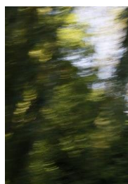
Illusion du mouvement